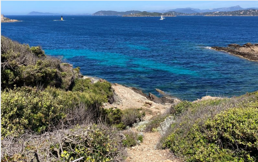
Paysage de Porquerolles