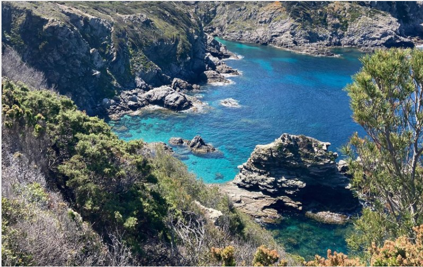
Falaises Porquerolles