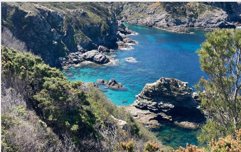
Falaises Porquerolles