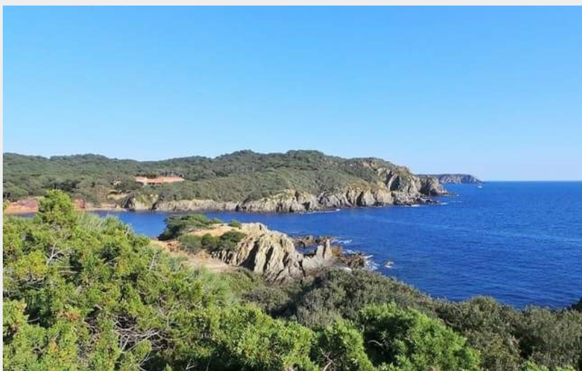
Crédit photo : Le Cycle Porquerollais (Un point de vue sur les caps )