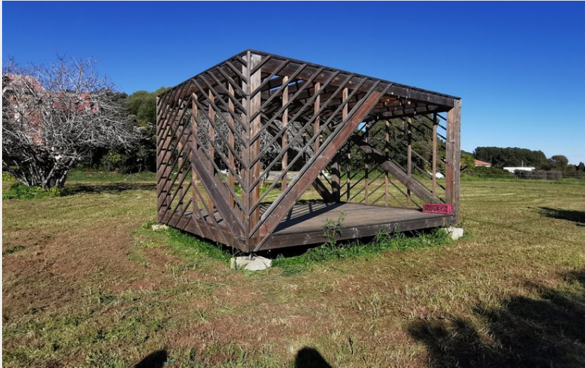
(Espace d'interprétation extérieur)