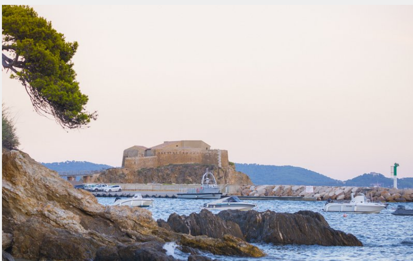
Crédit photo : Fort du Pradeau ©Lola Doux (Fort du Pradeau ©Lola Doux)