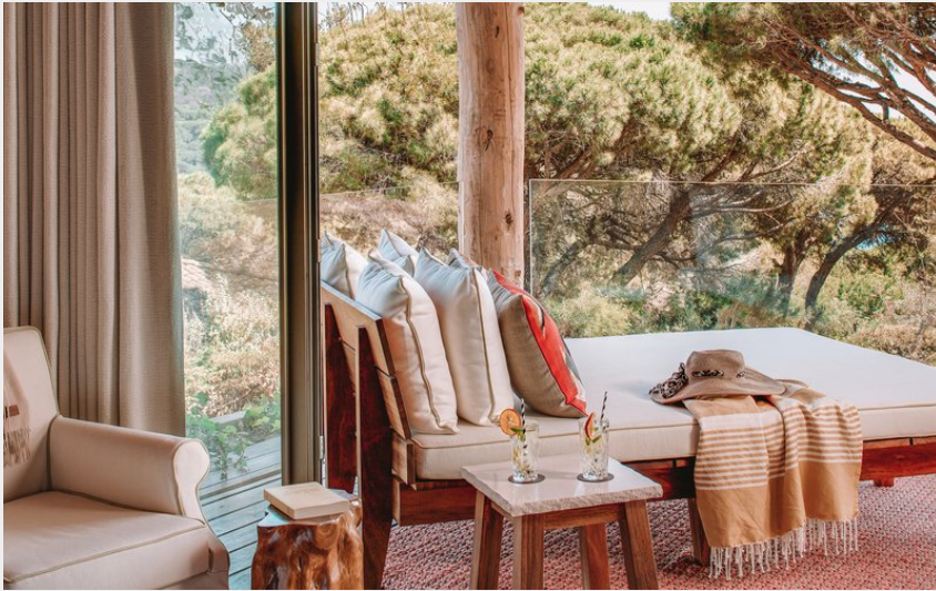
Crédit photo : Lily of the Valley (Carrousel - Suite Lily - extérieur)