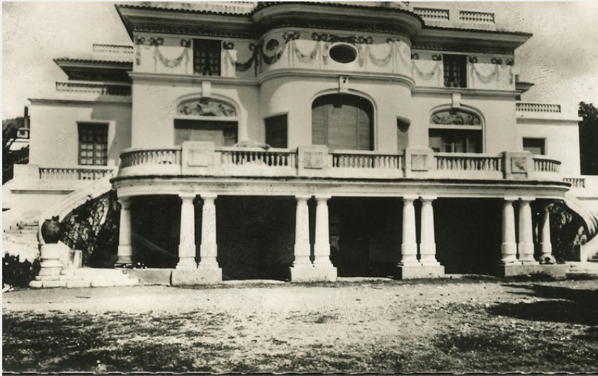
(Vieille carte postale de l'Hôtel de la mer)