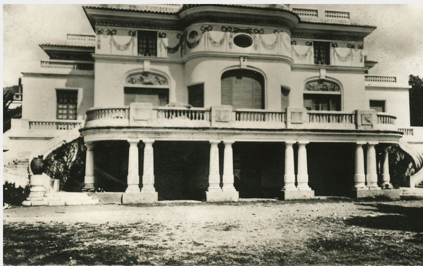
Crédit photo : Domaine du Rayol (Vieille carte postale de l'Hôtel de la mer)