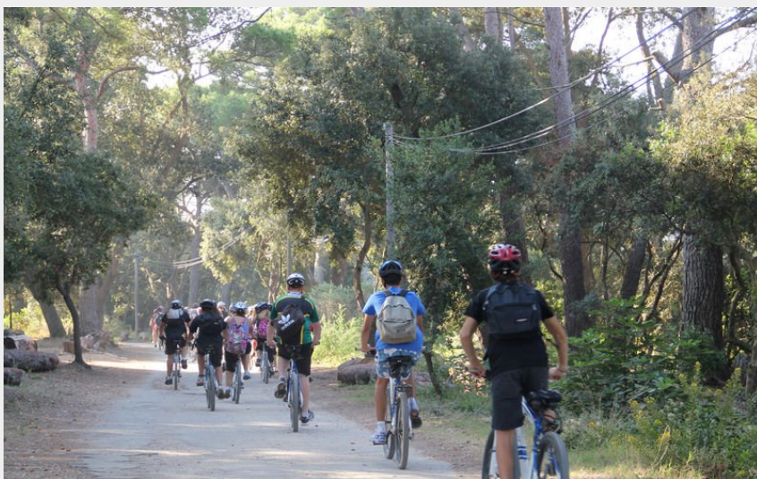
(En vélo sur l'île de Porquerolles)