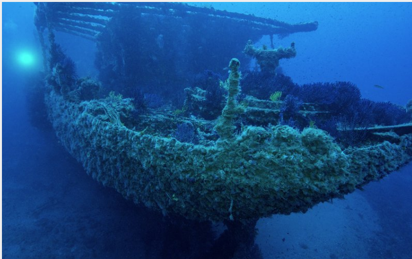
LE GREC - Ambiance poupe