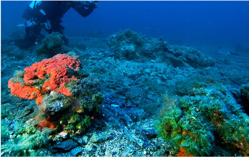
Le Galéasson